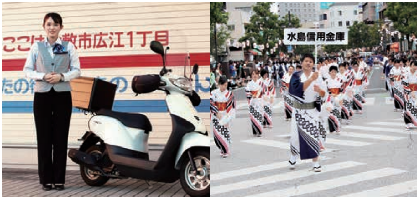
倉敷天領まつり 代官ばやしパレード