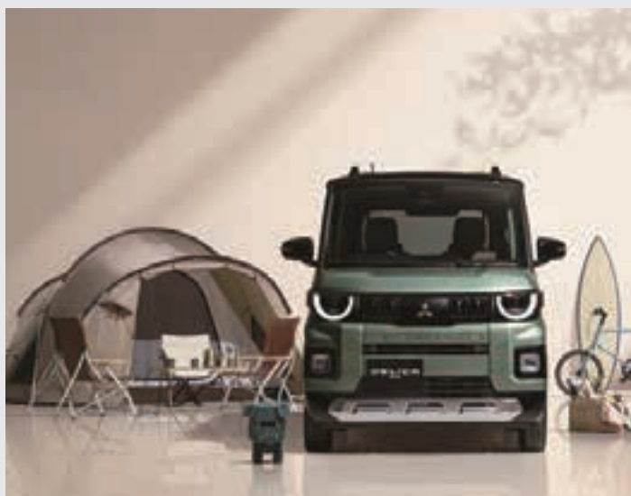
三菱自動車 新型デリカミニ