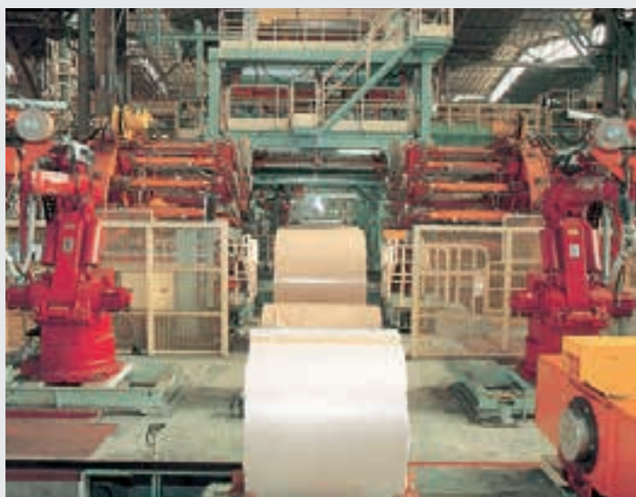
最新のFA技術と数々の斬新な発想を結集し、世界一の高自動化率と高生産性を可能にした自動コイル梱包ライン