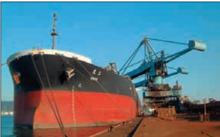
原料を荷揚げする連続式アンローダー