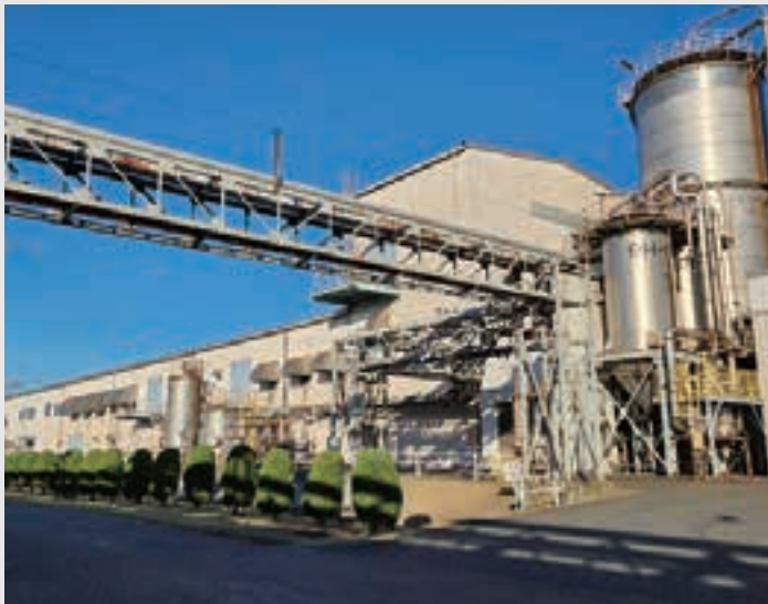
水島地区(筑波水島フィルム工場)