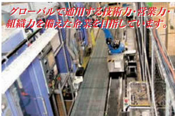
自動化(機械設備内製)