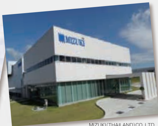
MIZUKI (THAILAND) CO., LTD.