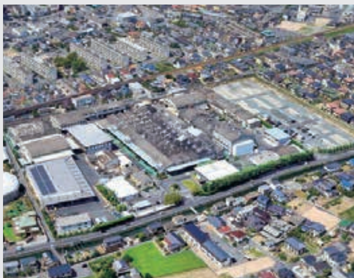
本社及び本社工場