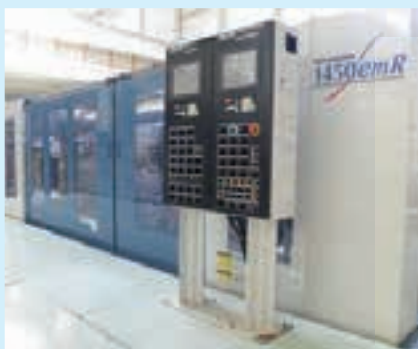
成形設備／二色回転式射出成形機 (400トン～4000トン 30台所有)