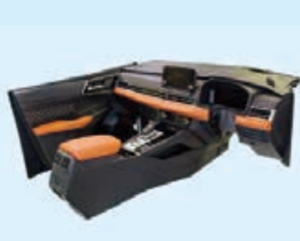
ドアトリム／インストルメントパネル／コンソール