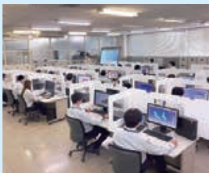
開発・設計/CADルーム

ものづくりの原点に立ち返り、製品一つ一つの品質や機能向上に努め 社会や地域の人々に豊かな生活をこれからも提供していきます。