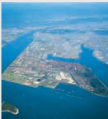
西日本製鉄所(倉敷地区)全景