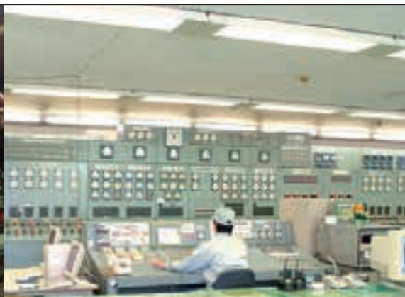
特高受変電所監視室