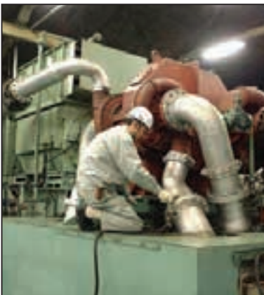
コンプレッサーの点検・整備