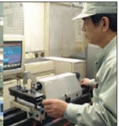
再研磨後のバイト角度測定

当社は、多くの技術者・有資格者を擁し高度な技能を有する、三菱自動車工業(株)100%出資の会社です。有能な技術者を目指し、資格取得にチャレンジするヤル気のある社員を積極的にバックアップしています。