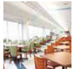
スタッフ専用のレストラン