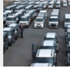
水島新車点検工場モータープール

三菱自動車ロジテクノは、大切なお客様のカーライフをより豊かなものにするために、粘り強くサービスを提供し続けることを使命としております。変革期の自動車業界において、これからもひたむきに、お客様の「こんなことできるかな?」の声に応え続けます。倉敷地区では車の部品を販売する中四国・九州地区事業部の他、新車点検・オプションパーツ取り付けを行う水島新車点検工場があり、当社の主要な拠点となっております。