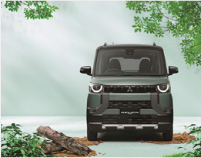
三菱自動車 デリカミニ