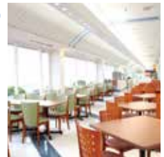
スタッフ専用のレストラン