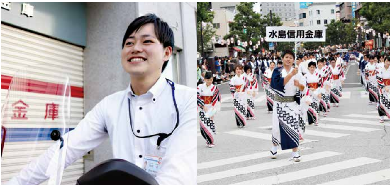
倉敷天領まつり 代官ばやしパレード