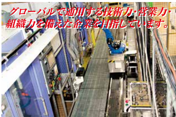
自動化(機械設備内製)