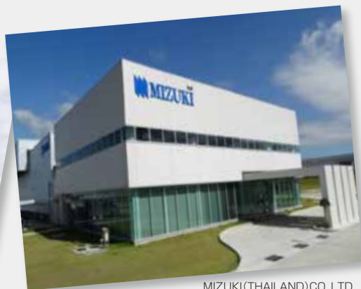
MIZUKI (THAILAND) CO., LTD.