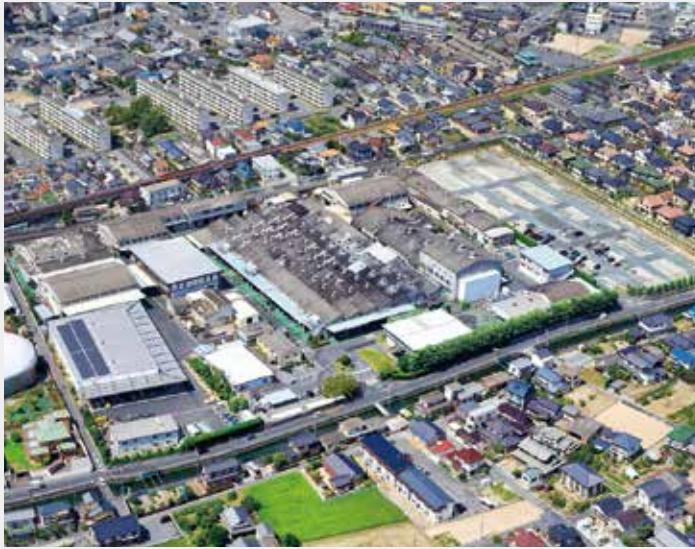
本社及び本社工場