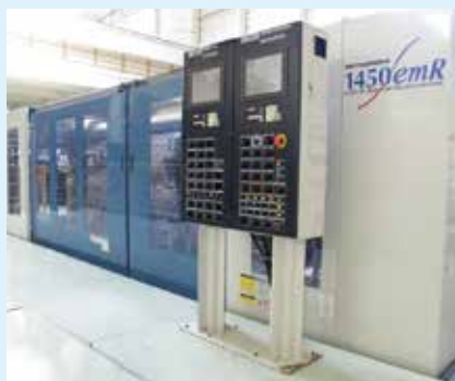
成形設備／二色回転式射出成形機 (400トン～4000トン 30台所有)