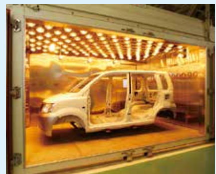
評価技術／大型恒温槽(熱環境試験)