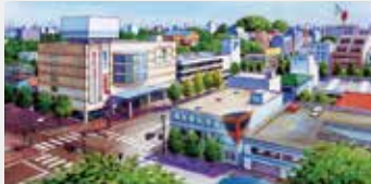
商業エリア 鉄骨の耐火被覆(粒状綿をセメントと混ぜて専用設備で吹付け)・天井ロックウール化粧吸音板(粒状綿は素材の一つ)