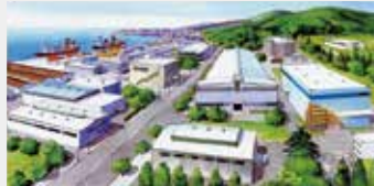
工業エリア 屋根断熱・ダブル折板間に挿入(フェルト)/壁断熱・金属サンドイッチパネル心材(ボード)