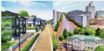
住宅エリア 壁・天井(断熱)マット/壁・天井(吸音)フェルト/壁・天井(防耐火)ボード