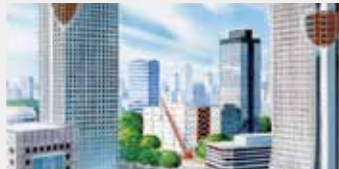
ビジネスエリア 配管・ダクトの保温材(ボード・フェルト)/地下機械室の防音(化粧ボード)