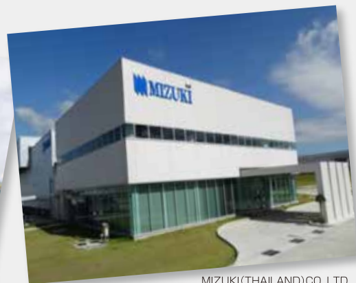
MIZUKI (THAILAND) CO., LTD.