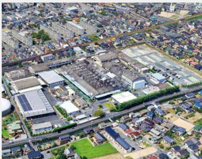
本社及び本社工場