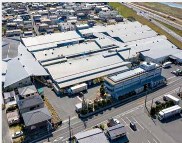
ワタナベ工業 清音工場