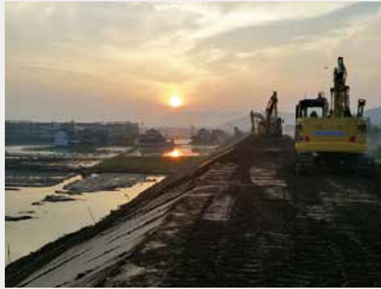
2018年7月 西日本豪雨災害復旧工事