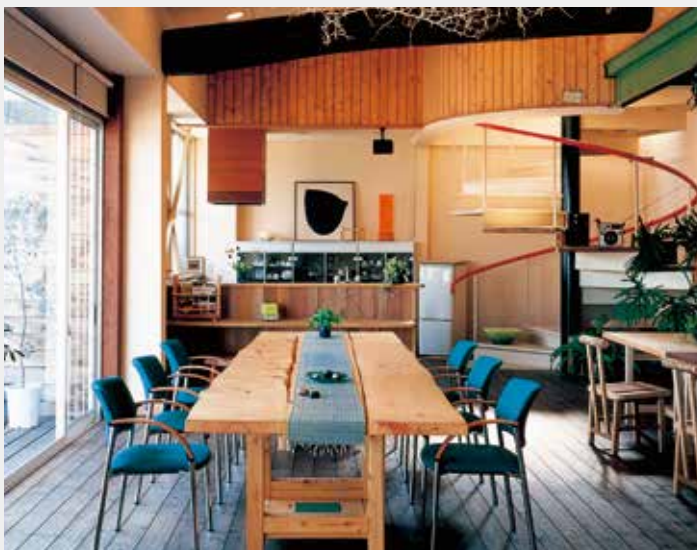
倉敷ショールーム