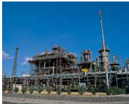
ポリプロピレンプラント