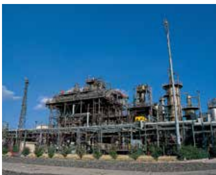
ポリプロピレンプラント