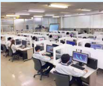
開発・設計/CADルーム