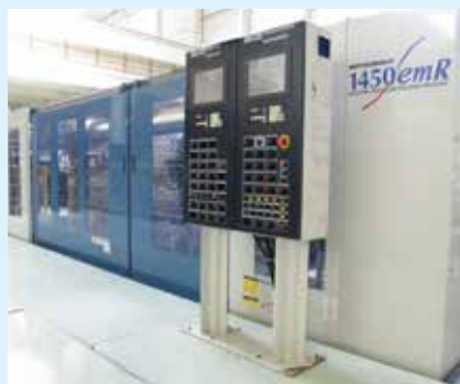
成形設備/二色回転式射出成形機 (400トン~4000トン 30台所有)