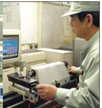
再研磨後のバイト角度測定

当社は、多くの技術者・有資格者を擁し高度な技能を有する、三菱自動車工業(株)100%出資の会社です。有能な技術者を目指し、資格取得にチャレンジするヤル気のある社員を積極的にバックアップしています。