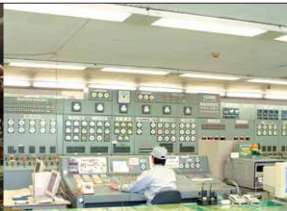
特高受変電所監視室