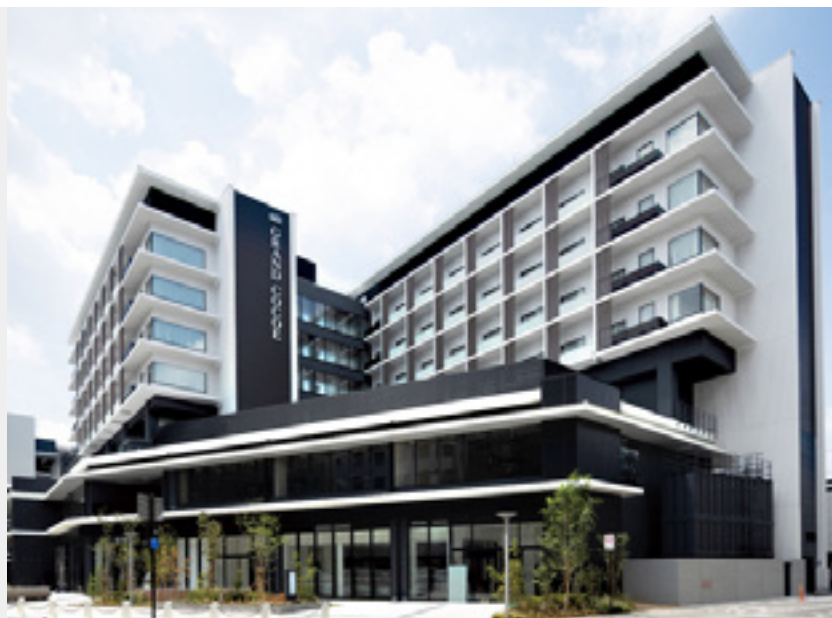
ホテル グラン・ココエ倉敷