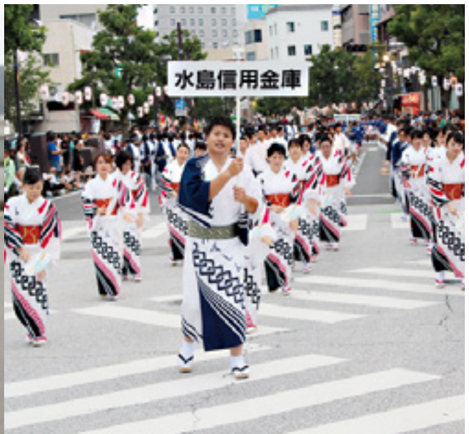
倉敷天領まつり 代官ばやしパレード