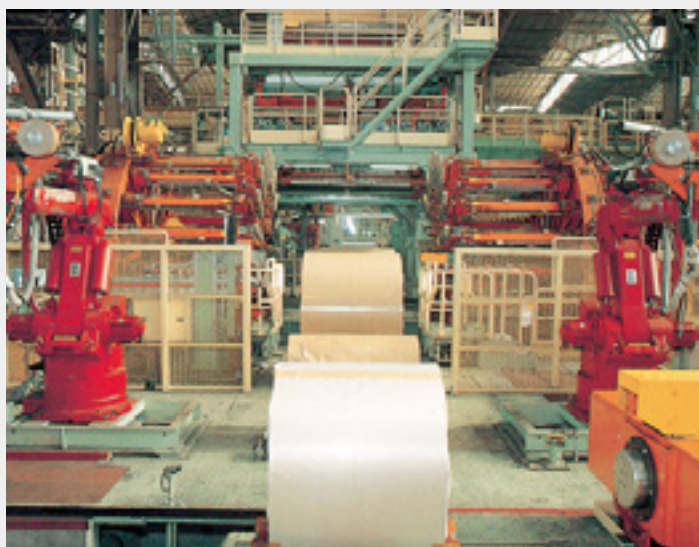
最新のFA技術と数々の斬新な発想を結集し、世界一の高自動化率と高生産性を可能にした自動コイル梱包ライン