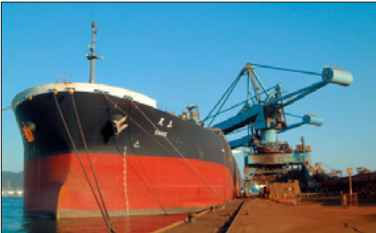
原料を荷揚げする連続式アンローダー