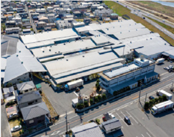
ワタナベ工業 清音工場