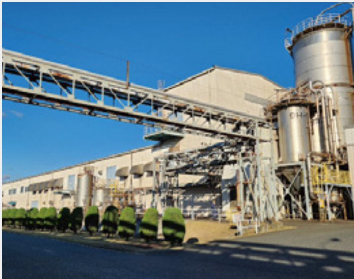
水島地区(筑波水島フィルム工場)