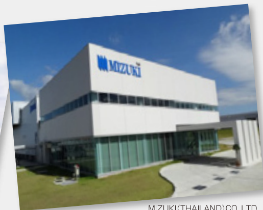
MIZUKI (THAILAND) CO., LTD.