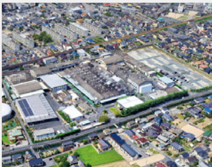
本社及び本社工場