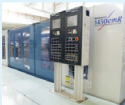
成形設備／二色回転式射出成形機 (400トン～4000トン 30台所有)