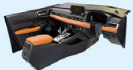
ドアトリム／インストルメントパネル／コンソール