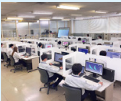
開発・設計/CADルーム

ものづくりの原点に立ち返り、製品一つ一つの品質や機能向上に努め 社会や地域の人々に豊かな生活をこれからも提供していきます。