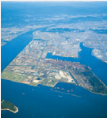
西日本製鉄所(倉敷地区)全景