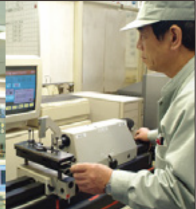
再研磨後のバイト角度測定

当社は、多くの技術者・有資格者を擁し高度な技能を有する、三菱自動車工業(株)100%出資の会社です。有能な技術者を目指し、資格取得にチャレンジするヤル気のある社員を積極的にバックアップしています。