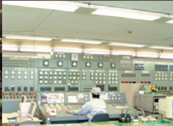
特高受変電所監視室