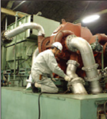
コンプレッサーの点検・整備