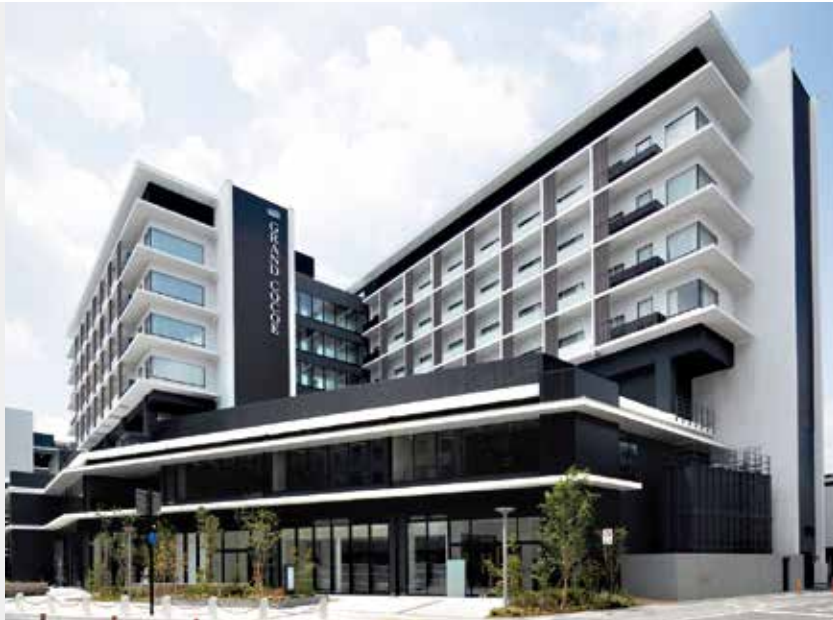
ホテル グラン・ココエ倉敷