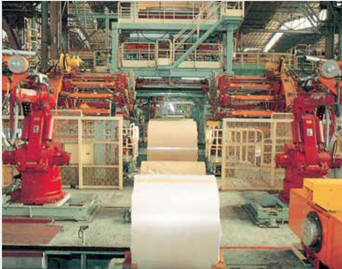
最新のFA技術と数々の斬新な発想を結集し、世界一の高自動化率と高生産性を可能にした自動コイル梱包ライン