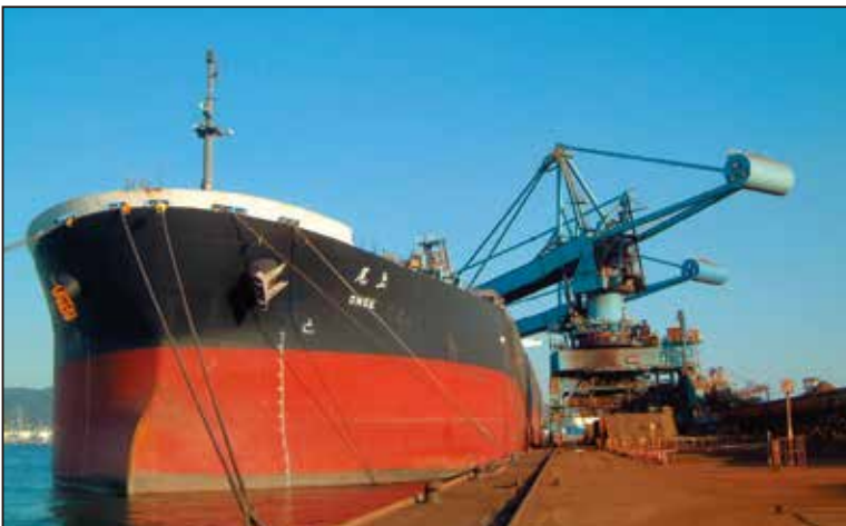
原料を荷揚げする連続式アンローダー