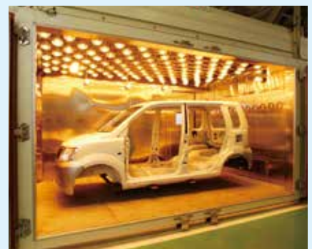
評価技術／大型恒温槽(熱環境試験)