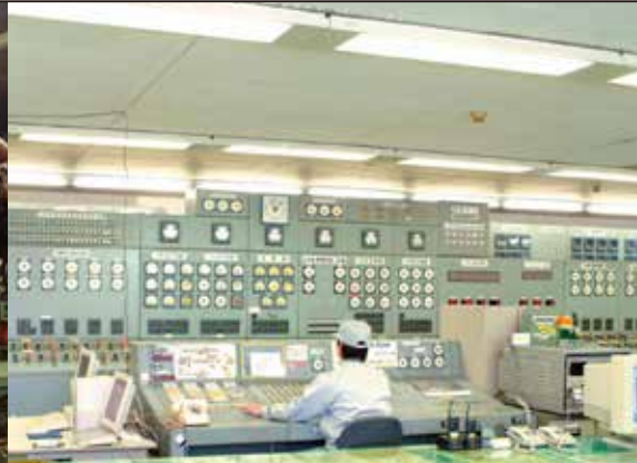
特高受変電所監視室