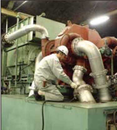
コンプレッサーの点検・整備