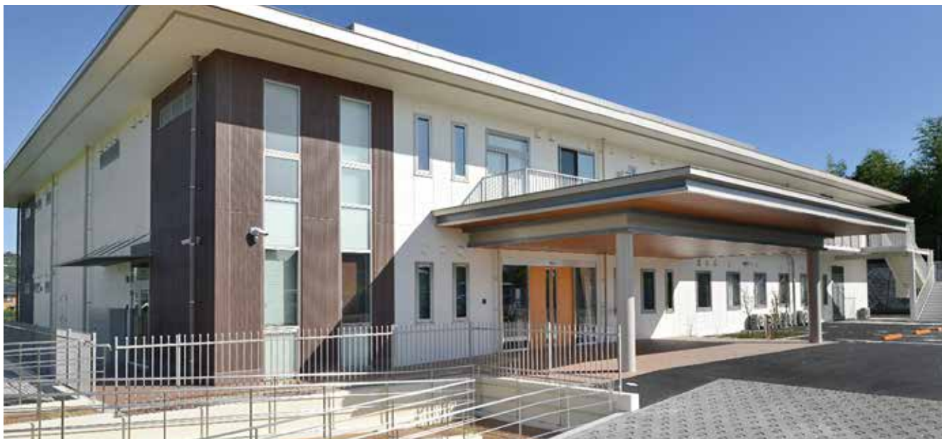
地域密着型特別養護老人ホーム ひかりの里 さと