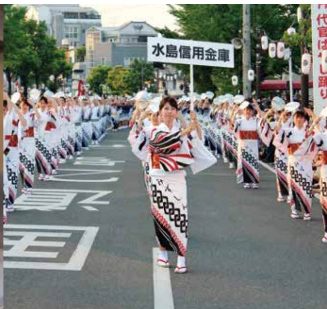
倉敷天領まつり 代官ばやしパレード