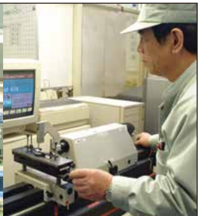
再研磨後のバイト角度測定

当社は、多くの技術者・有資格者を擁し高度な技能を有する、三菱自動車工業(株)100%出資の会社です。有能な技術者を目指し、資格取得にチャレンジするヤル気のある社員を積極的にバックアップしています。