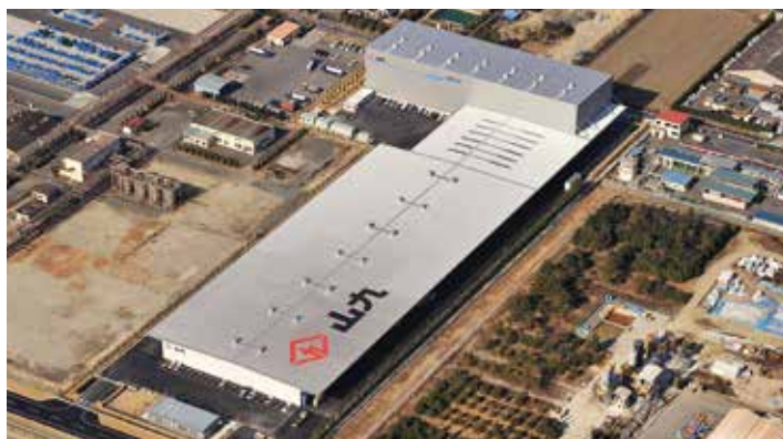
水島物流センター