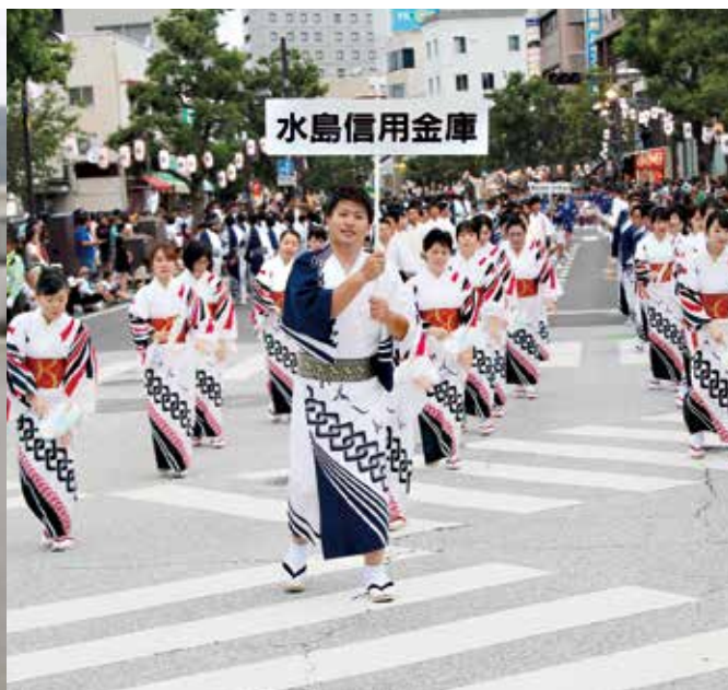
倉敷天領まつり 代官ばやしパレード